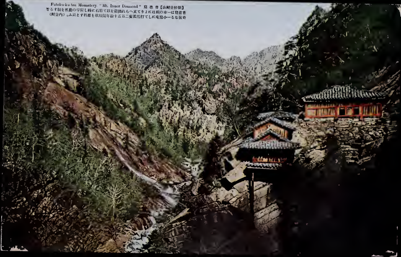
Futoku-ku-tsu Monastery. "Mt. Inner Diamond" 窟徳音【山剛金鮮朝】 ざるす刹を推動の字屋し構に石岩て以を鎮據れらへ支てりよに社祠の本一は窟徳音 （剛金内）。ふ云とす持雄を狀現即年餘十五百二套風雨打てしに庵窟小一なる抜奇